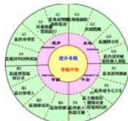
圖 1-2 課程願景