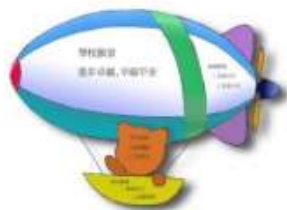
圖 1-1 學校願景